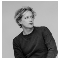
Yves Béhar Empresario y diseñador de producto