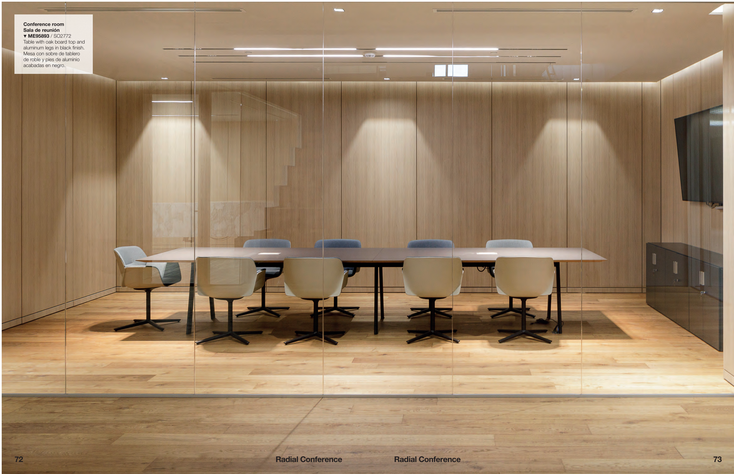
Table with oak board top and aluminum legs in black finish. Mesa con sobre de tablero de roble y pies de aluminio acabadas en negro.