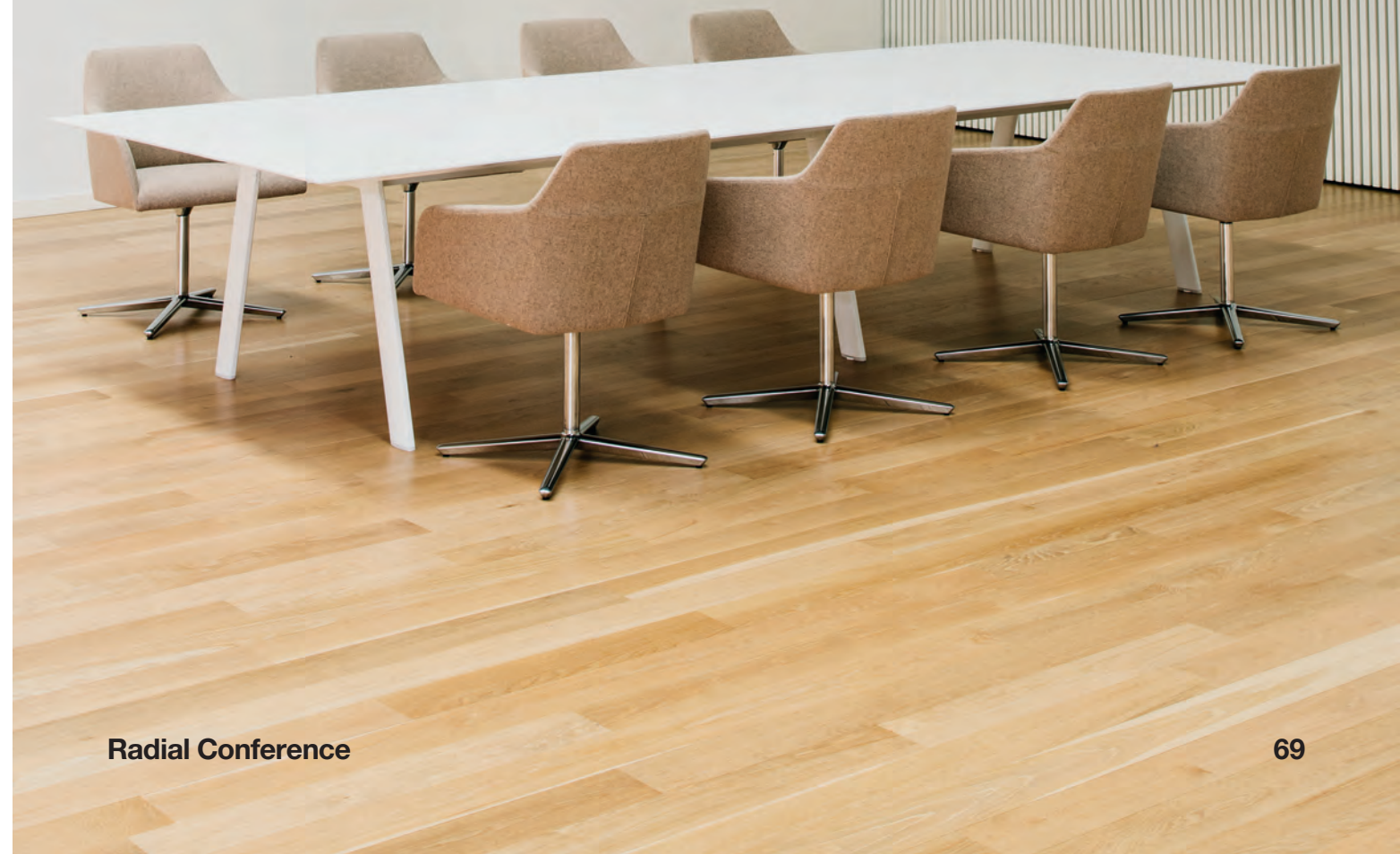
Table with aluminum legs in white finish with lacquered top. Mesa con pies de aluminio acabadas en blanco con sobre lacado.