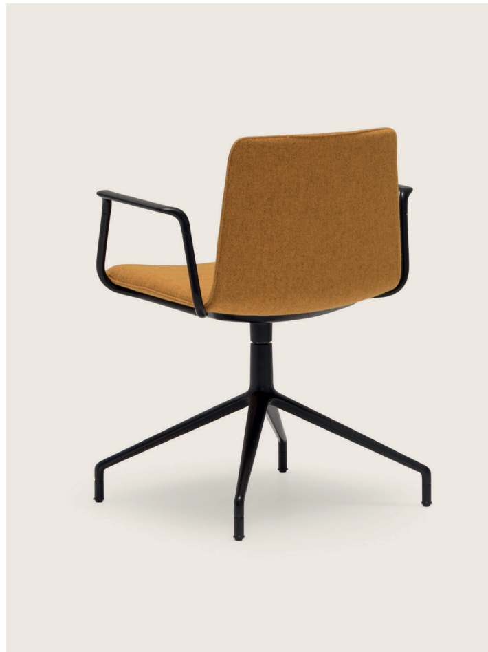
▲ SI1359* Upholstered chair with steel cantilever base. Silla tapizada con base cantiléver de acero.