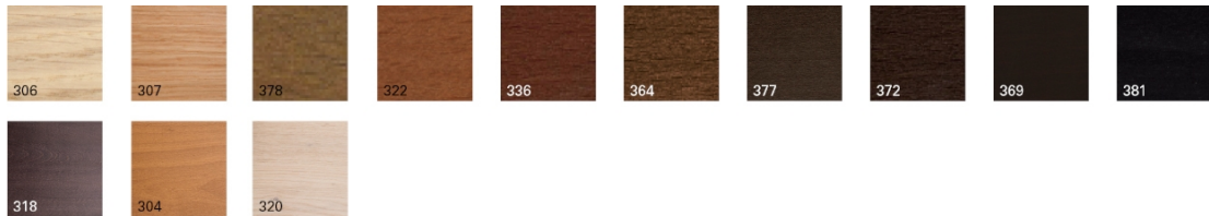
Acabado de madera de Roble